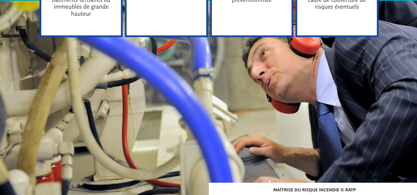
MAÎTRISE DU RISQUE INCENDIE

Mise en place d'assurances décennales pour l'activité CSSI dans le cadre de couverture de risques éventuels