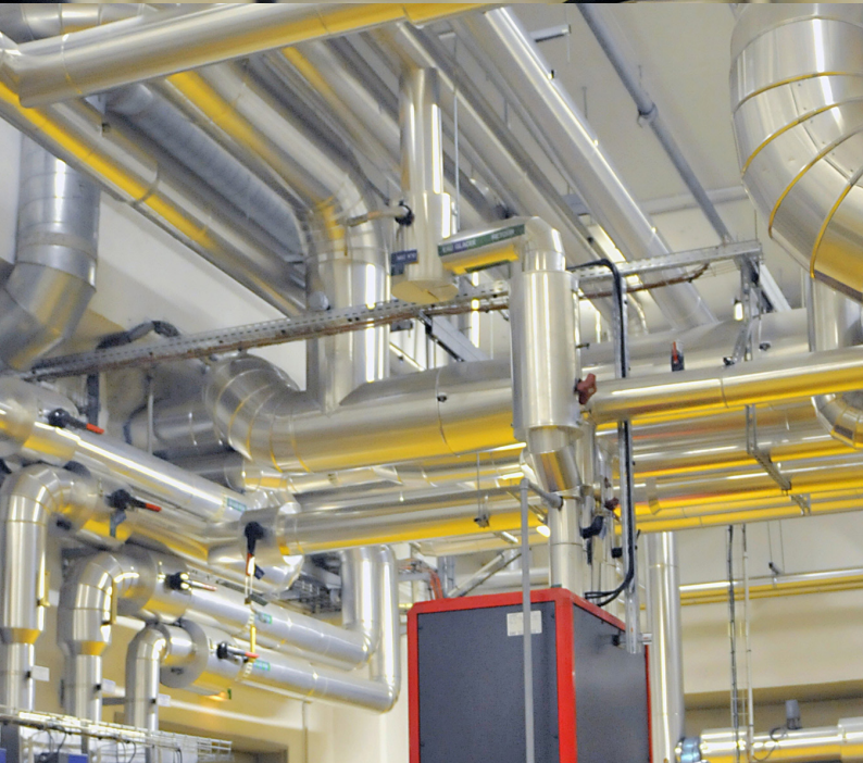
MAÎTRISE DU RISQUE INCENDIE