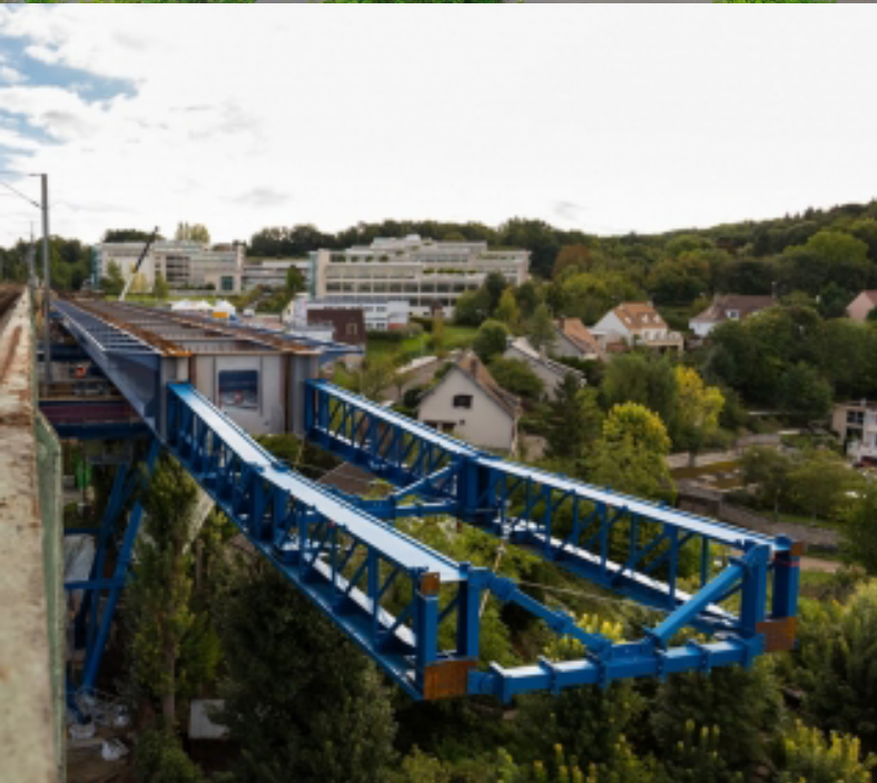
VIADUC MARLY-LE-ROI