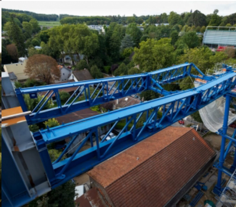
VIADUC MARLY-LE-ROI