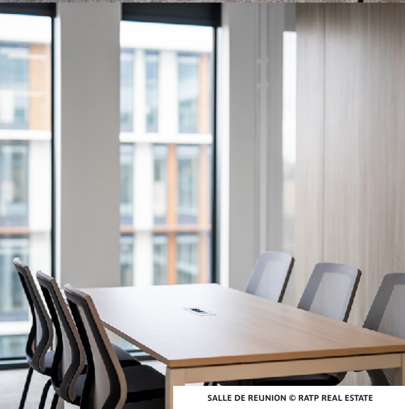
SALLE DE REUNION