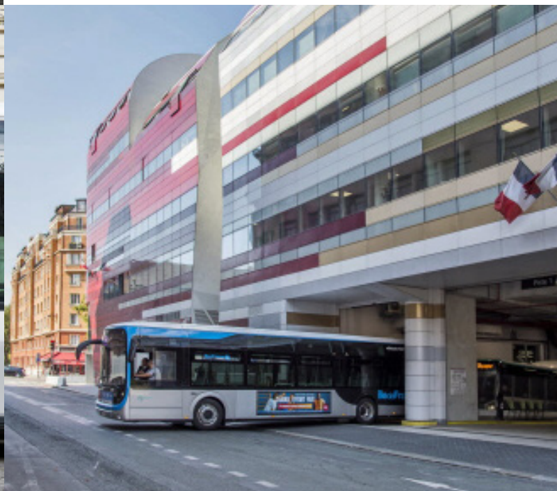
CENTRE BUS DE LAGNY