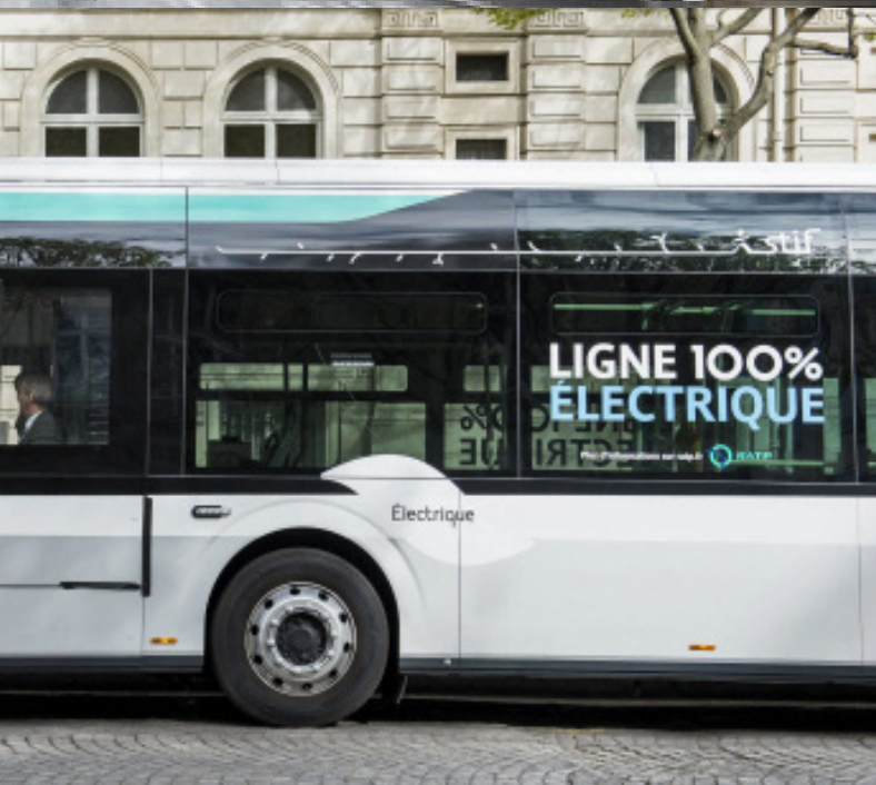
LIGNE 341