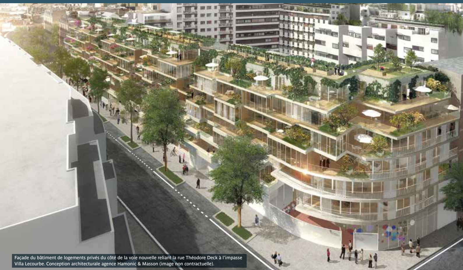
Façade du bâtiment de logements privés du côté de la voie nouvelle reliant la rue Théodore Deck à l'impasse Villa Lecourbe. Conception architecturale agence Hamonic & Masson (image non contractuelle).