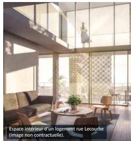
Espace intérieur d'un logement rue Lecourbe (image non contractuelle).