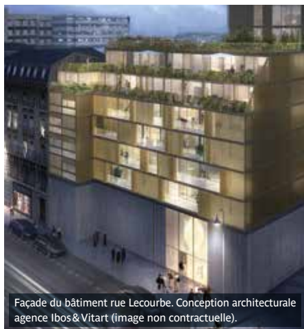
Façade du bâtiment rue Lecourbe. Conception architecturale agence Ibos & Vitart (image non contractuelle).

Un jury composé de représentants de la RATP, de ses filiales immobilières SEDP et Logis Transports, de la Ville de Paris et de la mairie du XV e arrondissement, a confié au groupement Emerige Résidentiel et Icade Promotion la conception architecturale, la maîtrise d'ouvrage et l'animation des logements privés des Ateliers Vaugirard. Originale à plus d'un titre, la consultation mettait en compétition cinq groupements réunissant un maître d'ouvrage, deux architectes (un par lot pour assurer la diversité et la cohérence du quartier) et des partenaires chargés de l'animation du rez-de-chaussée à travers la création de commerces et de services. Les deux lots d'habitations privées, construits l'un le long de la voie nouvelle