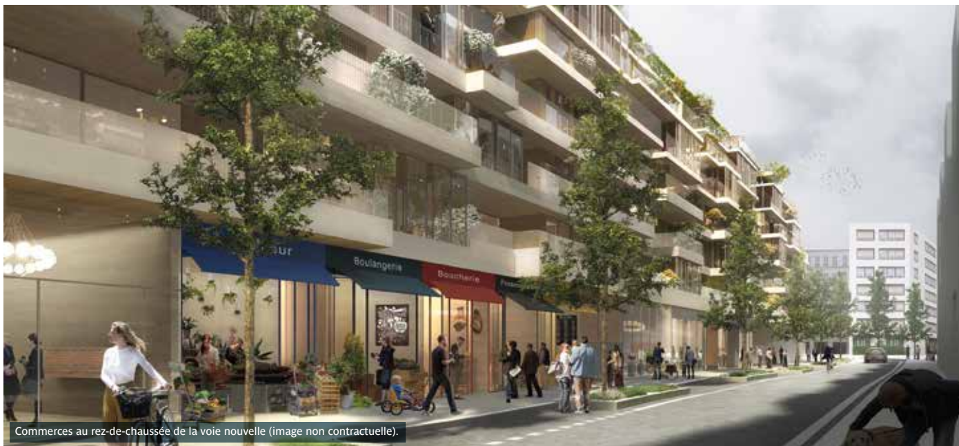
Commerces au rez-de-chaussée de la voie nouvelle (image non contractuelle).

La consultation de promoteurs et d'architectes lancée par le groupe RATP pour la réalisation de deux ensembles immobiliers privés a abouti au choix d'un véritable concept global, alliance de logements séduisants, de commerces de proximité, d'espaces verts et d'équipements publics et culturels.