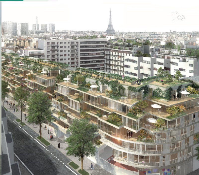
ATELIERS VAUGIRARD