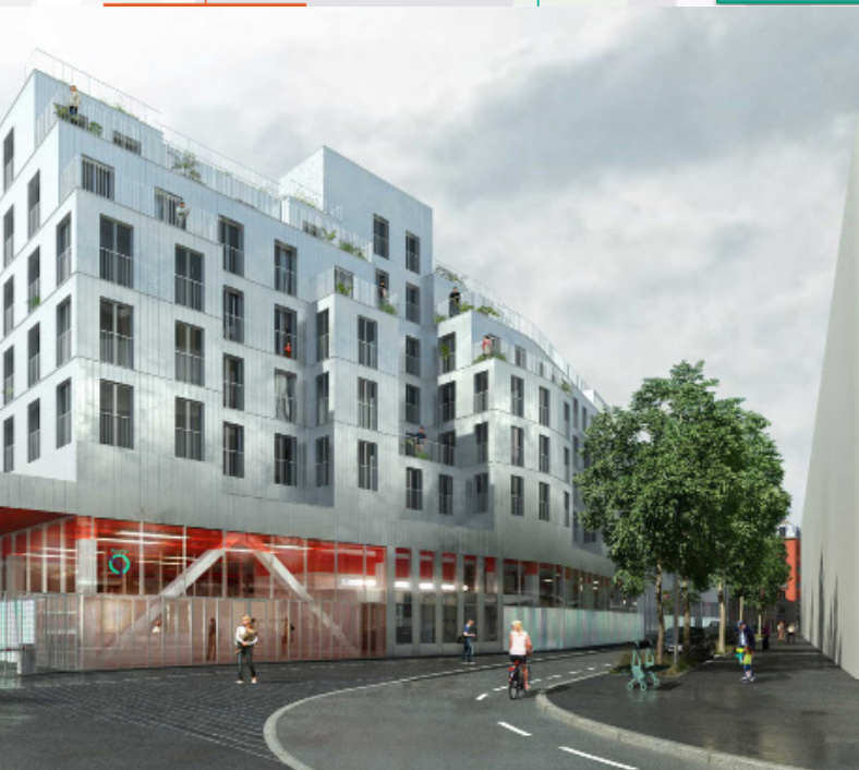
ATELIERS VAUGIRARD ©CHRIST & GANTENBEIN