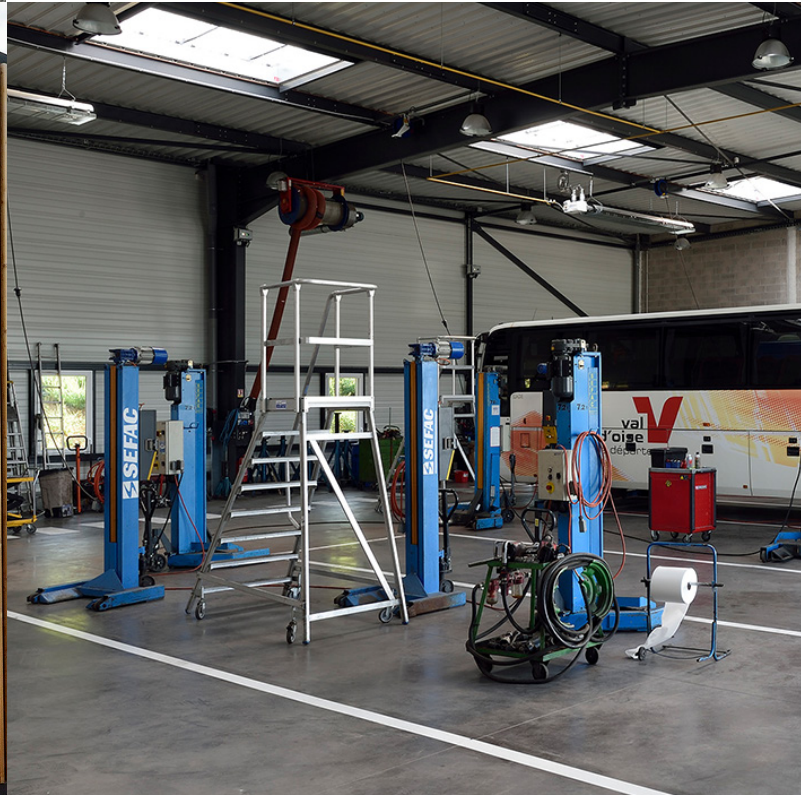
ATELIER DE MAINTENANCE