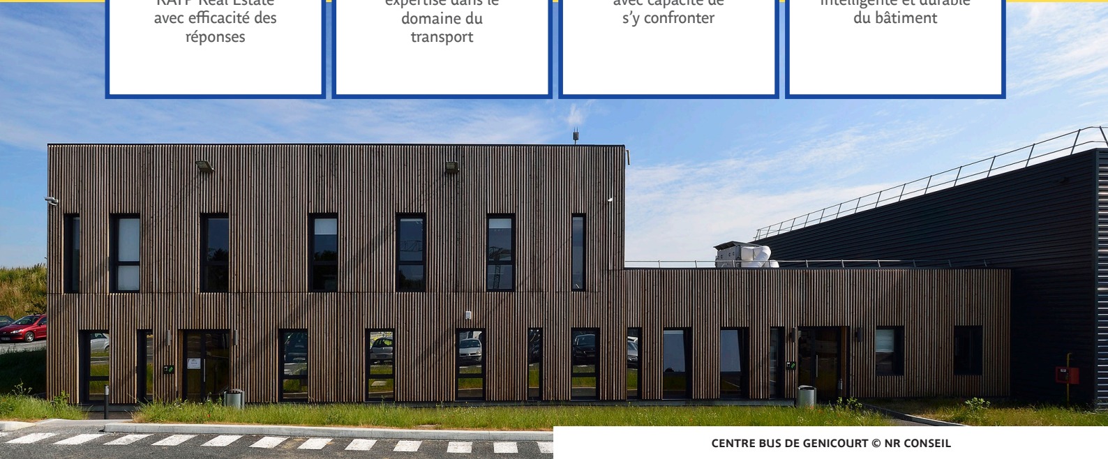
CENTRE BUS DE GENICOURT